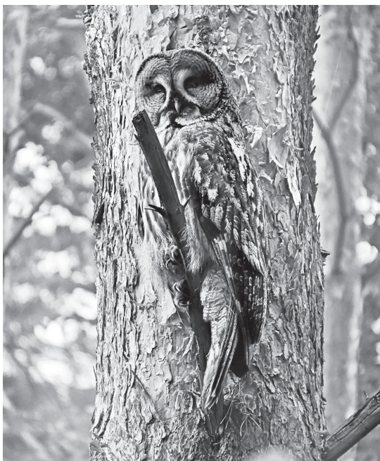
Взрослая неясыть.

Было решено, что воспитанники школьного лесничества вместе с сотрудниками парка будут заниматься нестбоксингом (англ. nest box — гнездовой ящик) — привлечением птиц на размножение в искусственные гнездовья-совятники. Проект планировался многолетний, направленный на решение сразу двух проблем: восстановление численности длиннохвостой неясыти и получение новых данных о ее гнездовой биологии. Поскольку сама неясыть гнезд не строит, предполагалось, что совятники станут постоянным жилищем этой птицы на