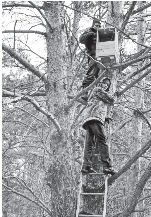
Установка совятника.

Трудности передвижения к совятникам на большие расстояния через грязь тоже не способствовали детскому энтузиазму. Поздней весной я несколько раз возила детей на своей машине. Однако в распутицу, когда совы делают кладки,